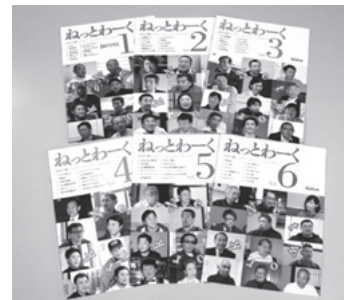
(企業紹介冊子「ねっとわーく」 年2回発行)

『このう』では、お取引先の事業内容や経営理念などを紹介し、新たなビジネスに繋げていただくために企業紹介冊子「ねっとわーく」を発刊しています。