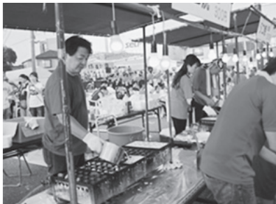
(2015.8.1 パセオ・サマーフェスタ)

『このう』では、各営業店が地域の社会貢献活動に積極的に取り組んでおり、お祭りをはじめ地域行事に参加し、地域との交流を深めています。