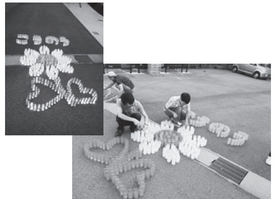
(2015.8.29 あかりイベント 「カフェ、ローエル」)