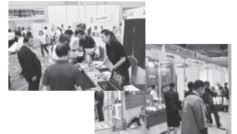
(シグマバンクビジネスフェアほか)